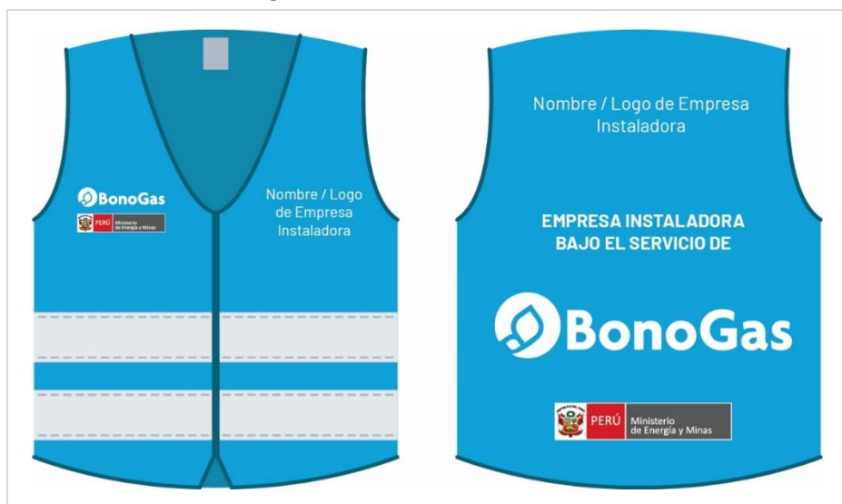
Fig. 04: Chaleco de identificación