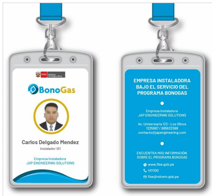
Fig. 03: Fotocheck de identificación