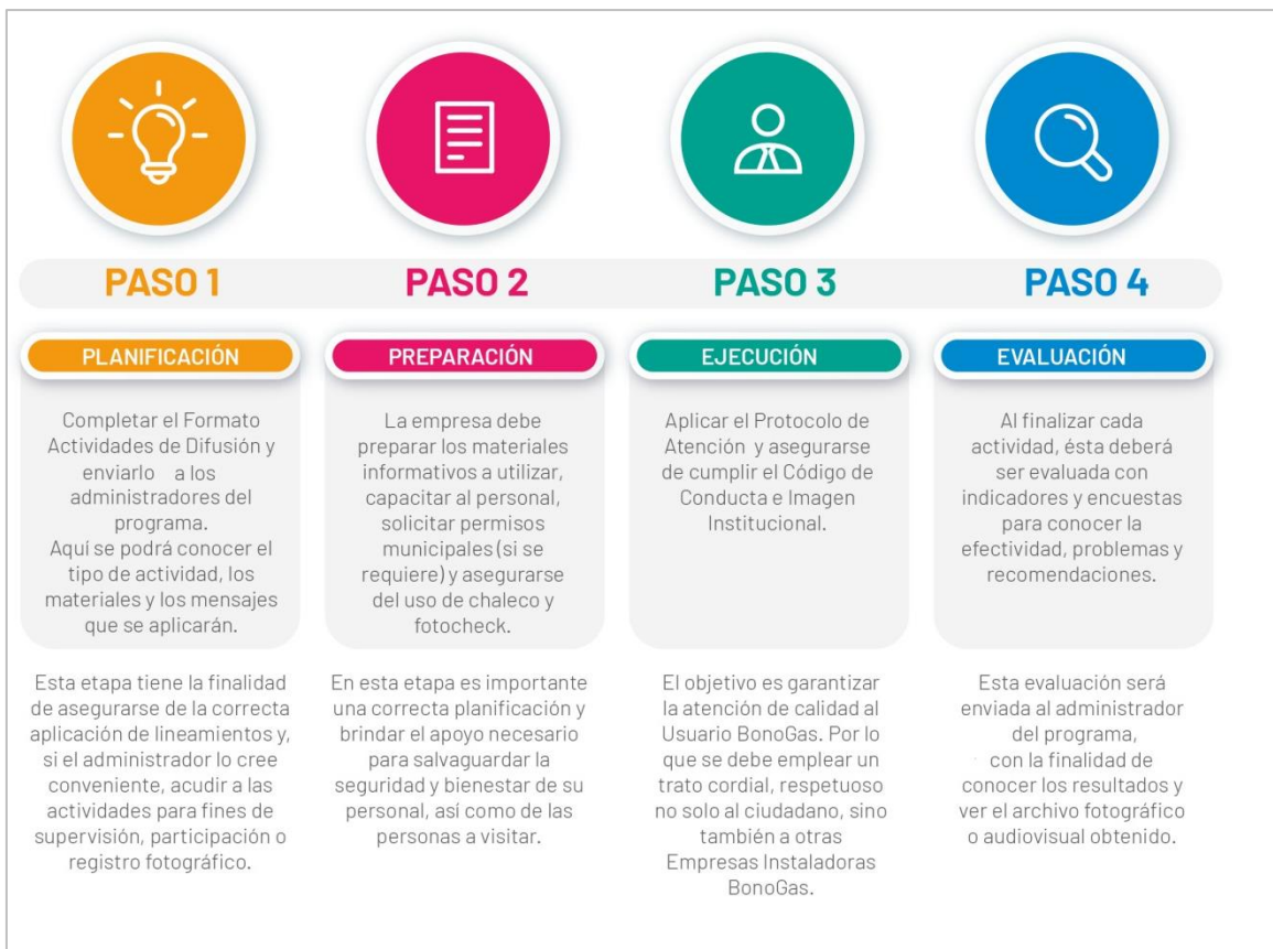
Fig. 02: Etapas para realizar una actividad de promoción y difusión